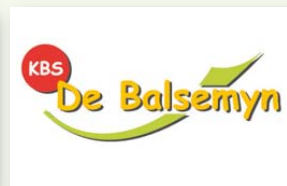
CBS de Balsemyn